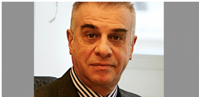
Gio, 31 Mar 2016