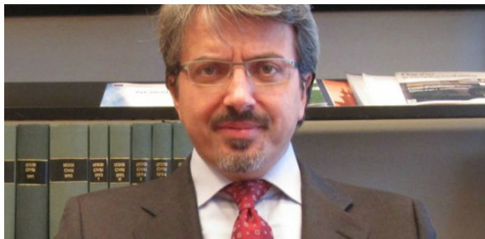
Ven, 10 Giu 2016

Newsletter (/newsletter) Contatti (/contatti) in (https://www.linkedin.com/groups/legalcommunityit-4133057) f (https://www.facebook.com/legalcommunity.it) (https://www.twitter.com/legal_community) (feed-articoli) Home (/) > Aree di Attività (/aree-attivita) > Societario (/aree-attivita/societario)