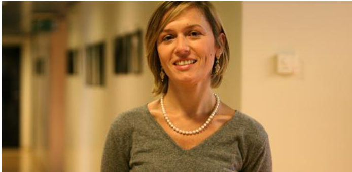
Ven, 04 Nov 2016