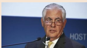
VIOLATE SANZIONI CONTRO LA