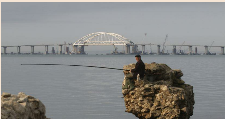
Il ponte che collega la Crimea alla costa russa del Mar Nero è diventato uno dei simboli del confronto tra la Russia e l'Occidente