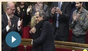
MONDO | 14 maggio 2018 Catalogna, il Parlamento elegge Quim Torra presidente