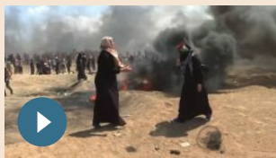
MONDO | 14 maggio 2018 Ambasciata Usa: Israele trionfa, uccisi almeno 35 palestinesi