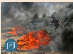
MEDIO ORIENTE E AFRICA | 14 maggio 2018 Scontri a Gaza tra palestinesi ed esercito israeliano, vittime