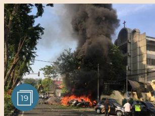
ASIA E OCEANIA | 13 maggio 2018 Indonesia, attentati contro chiese cristiane