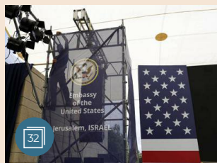
MEDIO ORIENTE E AFRICA | 14 maggio 2018 Ivanka Trump, Kushner e Mnuchin a Gerusalemme per l'inaugurazione dell'ambasciata Usa