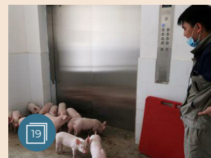
ASIA E OCEANIA | 12 maggio 2018 La Cina apre gli «hotel per maiali», allevamenti intensivi alti 13 piani