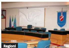
Regioni Molise: nominati i quattro assessori della Giunta